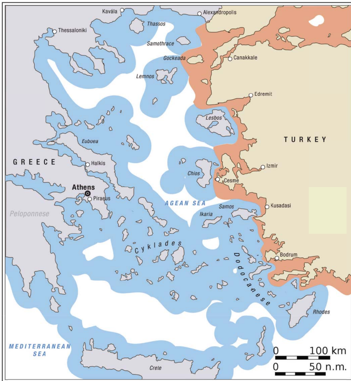
Map of the Aegean, with approximate extent of current 12nm territorial waters. http://en.wikipedia.org/wiki/File:Aegean_12_nm.svg